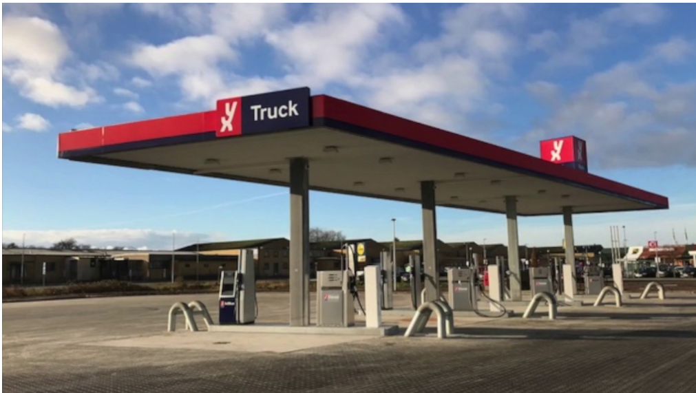
Modelfoto af et lignende anlæg